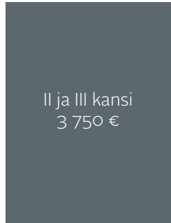
Kokonaispinta-ala 210 x 275 + leikkuuvara 5 mm.