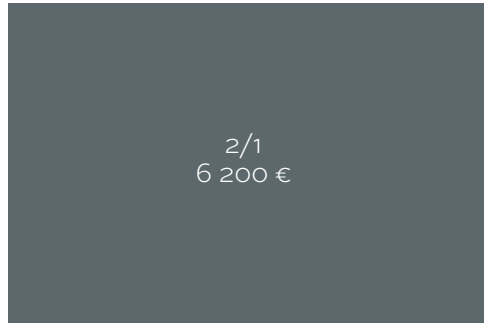
Kokonaispinta-ala 420 x 275 + leikkuuvara 5 mm.