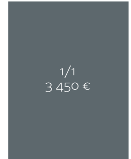
Kokonaispinta-ala 210 x 275 + leikkuuvara 5 mm.