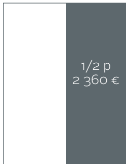
Kokonaispinta-ala 102 x 275 + leikkuuvara 5 mm.