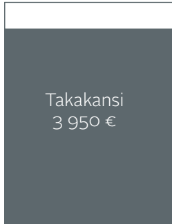
Kokonaispinta-ala 210 x 250 + leikkuuvara 5 mm.

Ilmoitushinnat sisältävät mainostilan lehdessä ja digilehdessä verkkolinkkeineen (html 5-versio lisämaksusta).