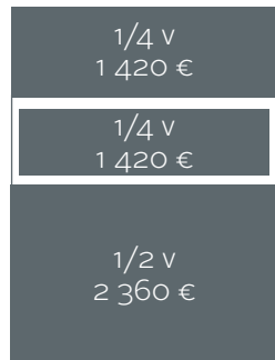
Kokonaispinta-ala 1/4 vaaka 210 x 67 + leikkuuvara 5 mm, 1/4 vaaka 178 x 60 (ei leikkuuvaroja), 1/2 vaaka 210 x 133 + leikkuuvara 5 mm.