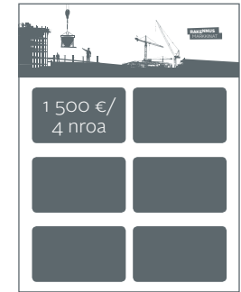
Rakennusmarkkinat-hakemisto: ilmoituskoko 80 x 50 mm. 1 500 €/4 numeroa, sis. hakemistopaikan koko vuoden ajalle myös www.rakennustaito.fi -sivustolla.

Liitteet: A5-A6 0,23 €/kpl, A4 0,32 €/kpl, A3 0,39 €/kpl, muut liitteet tarjouksen mukaan. Tarjolla määräpaikkailmoituksia kansien lisäksi myös pääartikkeleiden yhteyteen! Kysy myös advertoriaaleja sekä kampanja- ja vuosisopimustarjouksia.