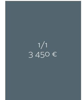
Kokonaispinta-ala 210 x 275 + leikkuuvara 5 mm.