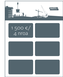
Rakennusmarkkinat-hakemisto: ilmoituskoko 80 x 50 mm. 1 500 €/4 numeroa, sis. hakemistopaikan koko vuoden ajalle myös www.rakennustaito.fi-sivustolla.

Liitteet: A5-A6 0,23 €/kpl, A4 0,32 €/kpl, A3 0,39 €/kpl, muut liitteet tarjouksen mukaan. Tarjolla määräpaikkailmoituksia kansion lisäksi myös pääartikkeleiden yhteyteen! Kysy myös advertoriaaleja sekä kampanja- ja vuosisopimustarjouksia.